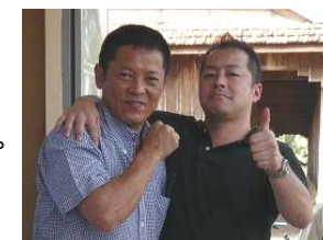
大西会長とカンボジアにて

カンボジアでカンボジアの方々に日本語と日本の介護の勉強をして頂き、本社の運営する老人介護施設グループホームで働いて頂く計画です。日本で働いて家族や兄弟に仕送りすればかなりの生活水準が上がります。カンボジアの貨幣価値は日本の50分の1以下ぐらいしかありません。実際にはもっと貨幣価値は低いように思います。警察官ですら月の給料が30ドルぐらいしかないので、月に1万円でも仕送りすれば約100ドル送っている事になるので約3ヶ月分ごはんが食べる事が出来ます。今回は現地で面接をする事になりました。