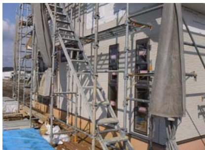
外壁工事も進んでいます。