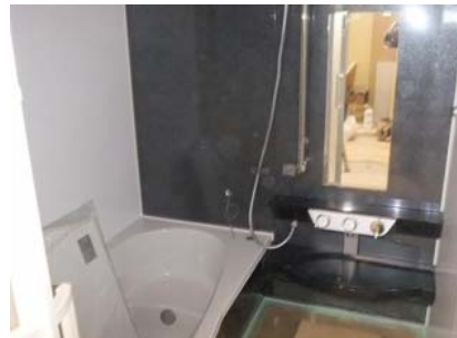
お風呂も組まれています。