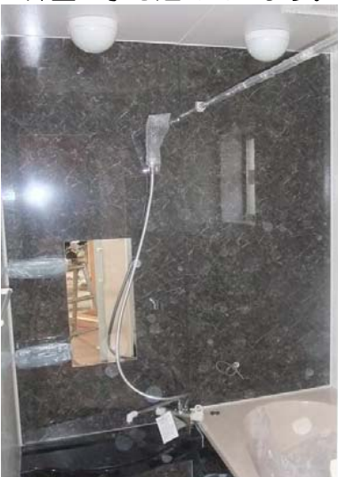
お風呂も組まれています。