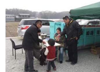
F様邸構造見学会にて！ OBのお客様が図面をチェック!(笑)

今年に入って正月休みからこっち丸一日の休み無し(汗)それでもお仕事があることは本当にありがたい事です。構造見学会に来て下さった皆様、本当にありがとうございます。心より感謝申し上げます。今回の構造見学会では新規のお客様と以前見学会に来て下さったお客様で9組のお客様のご来場でした。(嬉)今までで一番多かったのびびっくり!!!それだけ興味を持って頂き本当に嬉しく思います。OBのお客様もサクラ・・・?(笑)遊びに来て下さり本当にありがとうございます。心より感謝申し上げます。家は構造がしっかりしている事が一番大切な事だと私は思っています。デザインや住宅設備の仕様はお客様のご要望でどうにでもなります。今回のお客様のお宅も同様、お客様と一対一打ち合わせをさせて頂いて、ご要望をお聞きして、何度もプランを造らせて頂いた上で建てさせて頂いております。人が10人いれば10人とも考え方も違えば家に対しての夢や希望も違います。それをまとめさせて頂いた上でそれを形にするのが私の仕事です。本当にこんなに楽しい事はありません。旦那様、奥様、家の内容を決める事で夫婦ゲンカはダメですよ～(笑)家は普通は一生で一度の大きな買い物です。何度も家を建てられる方はなかなかいらっしゃいません。やはり簡単に決めてしまわず、色々な面から検討してその上で自分達で納得のいく家を建てて欲しいのです。私がお客様の家を建てさせて頂くにあたり、これは「ご縁」だと思っています。ご縁の無い方は当然他社とご縁があるわけですから、それはそれで仕方の無い事だと思います。家の構造や仕様が違えば値段が違ふのは当たり前です。また会社の利益設定も会社によって様々です。広告宣伝費や従業員の給料、モデルハウスや営業マンの給料、それもすべてお客様の家の利益から出ています。知ってもらうには広告宣伝費は絶対に必要・・・しかしどうすればその負担を減らす事が出来るのか?そしてどうすればお客様の負担を減らす事が出来るのか?それを考えている会社は少ないと思います。同じお金を出すなら自分の家に関係の無いお金は出たく無いですよね。私なら出たくありません。お客様に本当の適正価格を知って欲しいそして得て欲しい、そんな思いで私は二色刷りの安く済むあやしい(笑)広告を自分でパソコンで作ってます。業者さんに出すとデザイン料やらで高く付きますから・・・完成見学会の広告どうしようかな・・・う～ん・・・悩む・・・