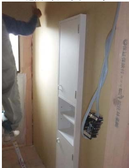
トイレの壁厚収納付きました。