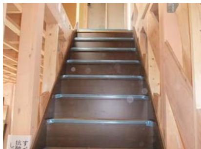
階段が掛かりました。