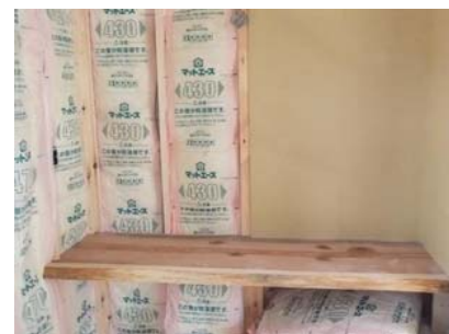
杉板の2F造作ドレッサー