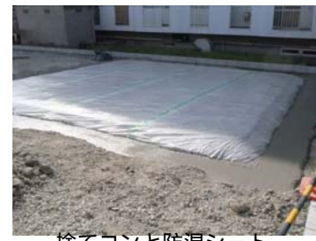
捨てコンと防湿シート