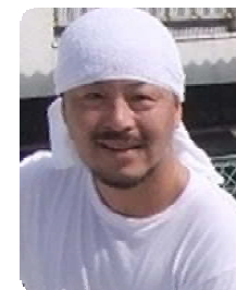
御用聞き しらやこういち

先月の30日、大安吉日に無事地鎮祭を迎えることが出来ました！〇様おめでとうございます！この日を首をなが〜くして 待っておりました！（^ 何ども打ち合わせをさせて頂き、地鎮祭までに内装の事まで全て決まってしまうました。 工事の方も着々と進んでおります。〇様邸でも構造見学会や完成見学会もさせて頂きますので皆様、是非見に来て 下さいね。（^ 工事の進行状況はブログ「御用聞き白矢が行く！」で随時写真付きで記載させて頂いております。 携帯でも見る事が可能ですので（御用聞き白矢が行くで検索）よかったら見てみて下さいね（^ いよいよ8月28日大安吉日上棟で〜す！内容はまたブログで写真付きでUpさせて頂きます！