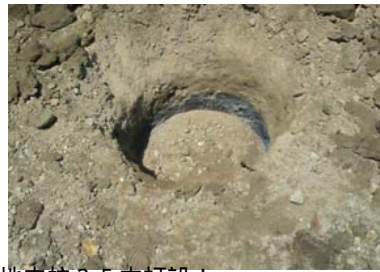
地盤改良工事中！直径50センチ3.5m地中杭25本打設！