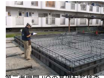
第三者機関JIOの基礎配筋検査